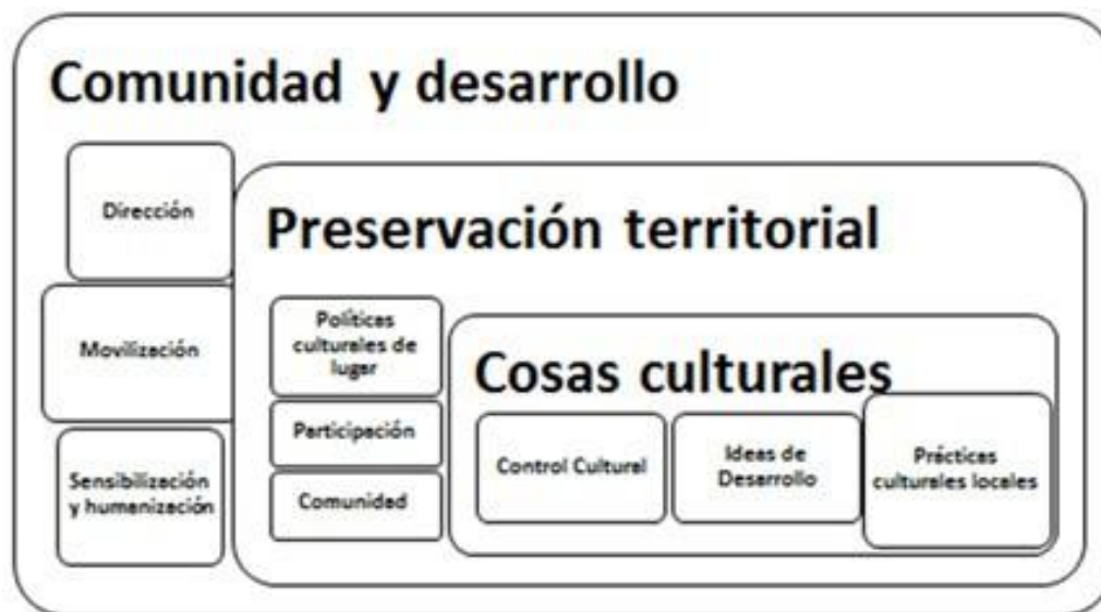
Matriz 4. Esquema de la relación entre territorio y desarrollo Cultural, para dar cuenta del lugar de las narrativas. Elaboración propia.

Observatorio Cultural del Proyecto Atalaya