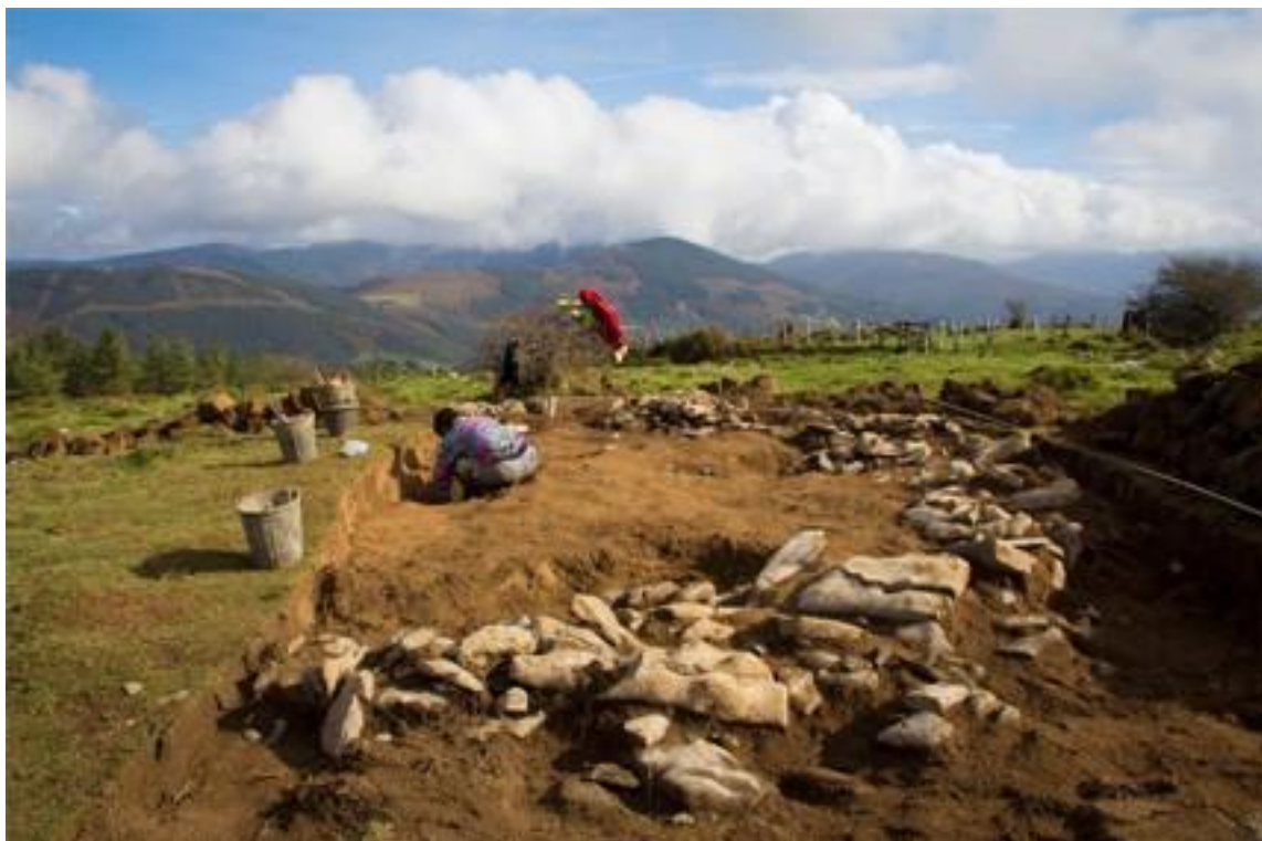
Las tres torres de Larte --- Larteko hiru dorreak.

Tan particular necrofilia funge como un despertador; es, en cierta forma, una resucitadora de pasados responsable de convertir los desechos culturales Independientemente de su uso, la espectacularidad inherente a los hallazgos arqueológicos, promueve la construcción social de al menos tres referentes fundamentales de una comunidad: el patrimonio común, la pertenencia comunitaria, y la localización de la [nota memoria territorialis los acervos arqueológicos y etnográficos del territorio ].