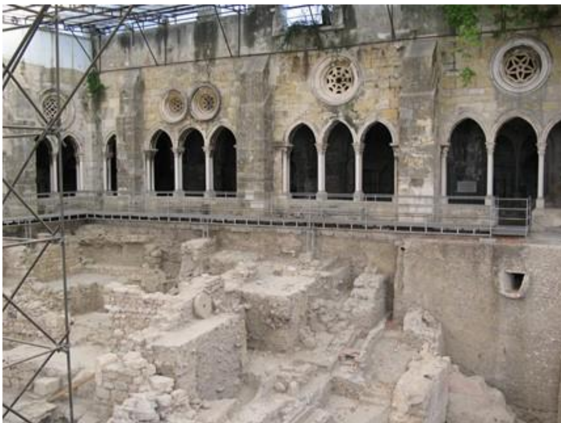
Excavación de la Catedral de Lisboa que da cuenta de la idea de palimpsesto, al reflejar los niveles estratigráficos de la construcción.

No hace falta, pues, pensar el desarrollo cultural desde los fenicios, al modo lineal, civilizatorio, universal y continuo de los evolucionistas del s. XIX, para entender que todo desarrollo conlleva apremios, esfuerzos, y cambios. Los sucesos locales y cercanos, aunque discontinuos y tan lejanos a las pretensiones de ser grandes gestas civilizatorias ---como el de El Gamonal, en Burgos (2014)---, también pueden describir el modo como se enfrentan las ideas de desarrollo y con la fuerza que pueden llegar a hacerlo. Lo que es modernización para unos, rompe las tradiciones de otros, y viceversa. Las ideas de desarrollo (modernización del espacio urbano mediante construcción de nuevos equipamientos y la destrucción de los viejos) se manifestaron en un conflicto territorial (lucha en la calle por mantener el paseo de la calle de Vitoria) del que emergió una territorialidad contrastante que movilizó sentimientos profundos (Barrio el Gamonal, obreros, resistentes, "efecto gamonalero").