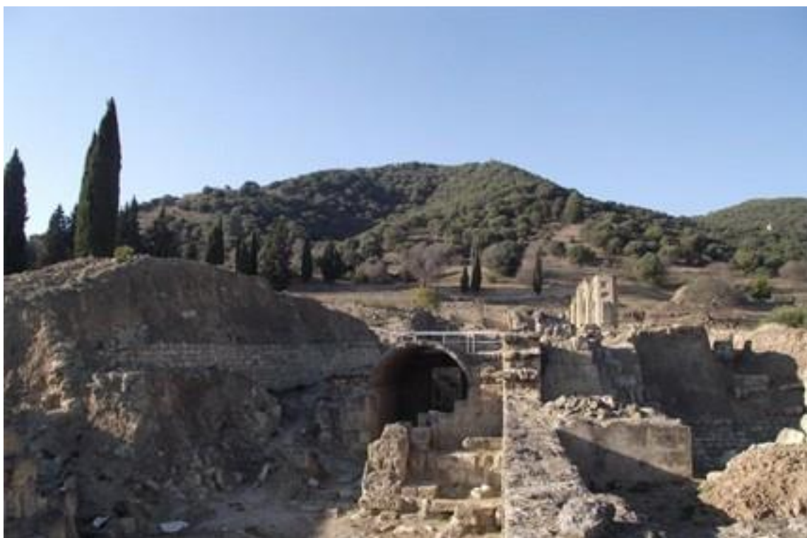
Medina Azahara, Córdoba. Detalle de la excavación del montículo que se había formado y que cubría el yacimiento arqueológico.

El desarrollo cultural se emplaza en el territorio en virtud de la relación entre cultura y naturaleza. El ser humano al ser consciente de que no controla los ritmos naturales, tiene que observarlos, analizarlos, conocerlos y poseerlos, mientras progresa en ello, crea herramientas e ingenia mañas para usar la fuerza que su limitado cuerpo no le brinda; e inventa dioses de las lluvias, de los vientos, de las cosechas, de las fiestas para que intercedan ante los peligros cotidianos y las acechanzas naturales. En la actualidad, persiste la intención de control, aún se siguen invocando dioses, y se persignan al salir de las casas. Verbos como cultivar y colonizar, etimológicamente parientes de la palabra cultura, son acciones que los seres humanos usan para apropiarse de entorno (incluida la población, vr. gr. "los naturales"), transformarlo y controlarlo; dichos verbos son económicos, además tan "espirituales" los dos como territoriales, pero más político uno que el otro, aunque ambos son indiscutiblemente poderosos.