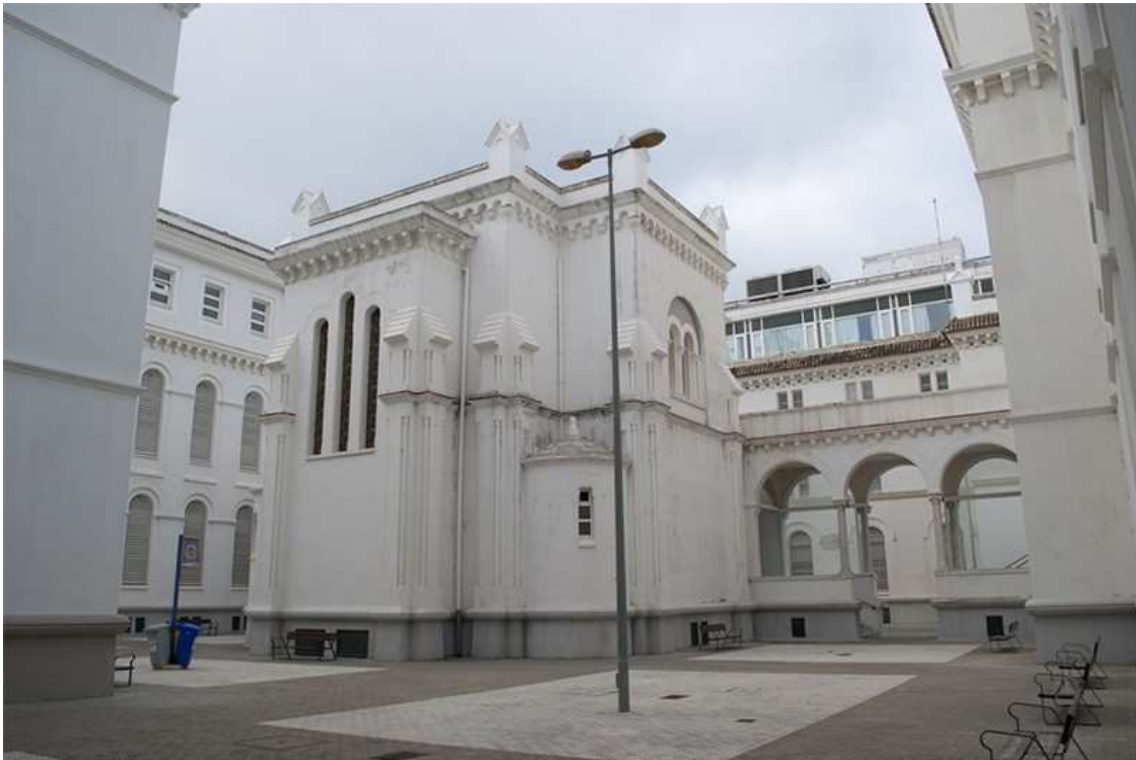
Observatorio Cultural del Proyecto Atalaya